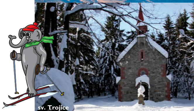
sv. Trojice Hora Matky Boží