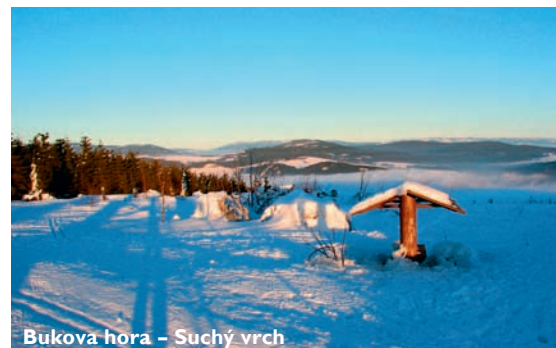
Bukova hora – Suchý vrch