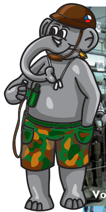
Vojenské muzeum Králíky

Investice do vaší budoucnosti Spolufinancováno Evropskou unií z Evropského fondu pro regionální rozvoj