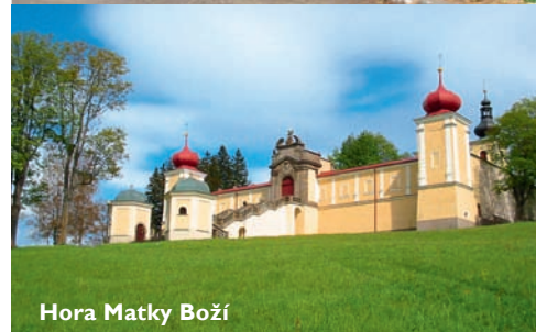
Hora Matky Boží