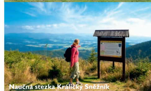
Naučná stezka Králický Sněžník