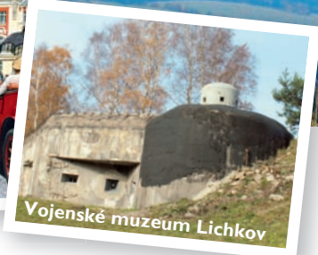
Vojenské muzeum Lichkov