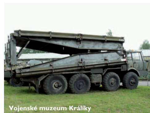
Vojenské muzeum Králíky

Králický Sněžník – Evropský dům Dlouhá 353, 561 69 Králíky tel.: +420 465 323 150, e-mail: evropskydum@email.cz www.evropskydum.krality.cz