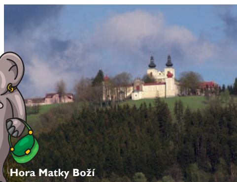
Hora Matky Boží