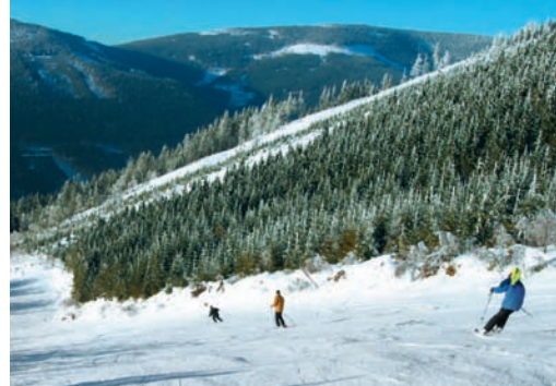
Hora Matky Boží