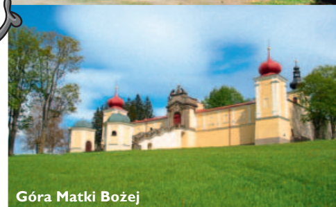
Góra Matki Bożej