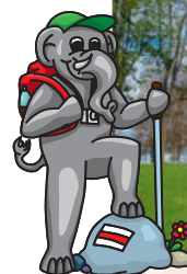
Góra Matki Bożej