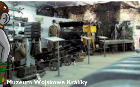
Muzeum Wojskowe Králíky