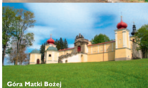
Góra Matki Bożej